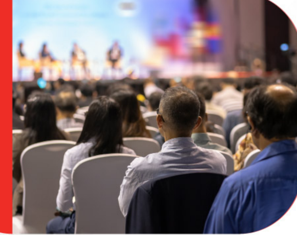
Sunum Teknikleri Eğitimi