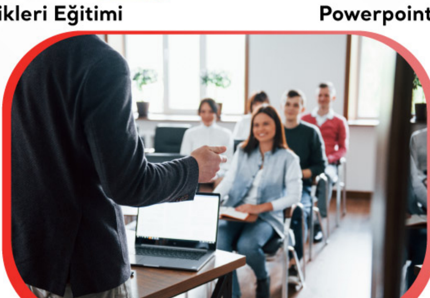
Etkin Performans Eğitimi